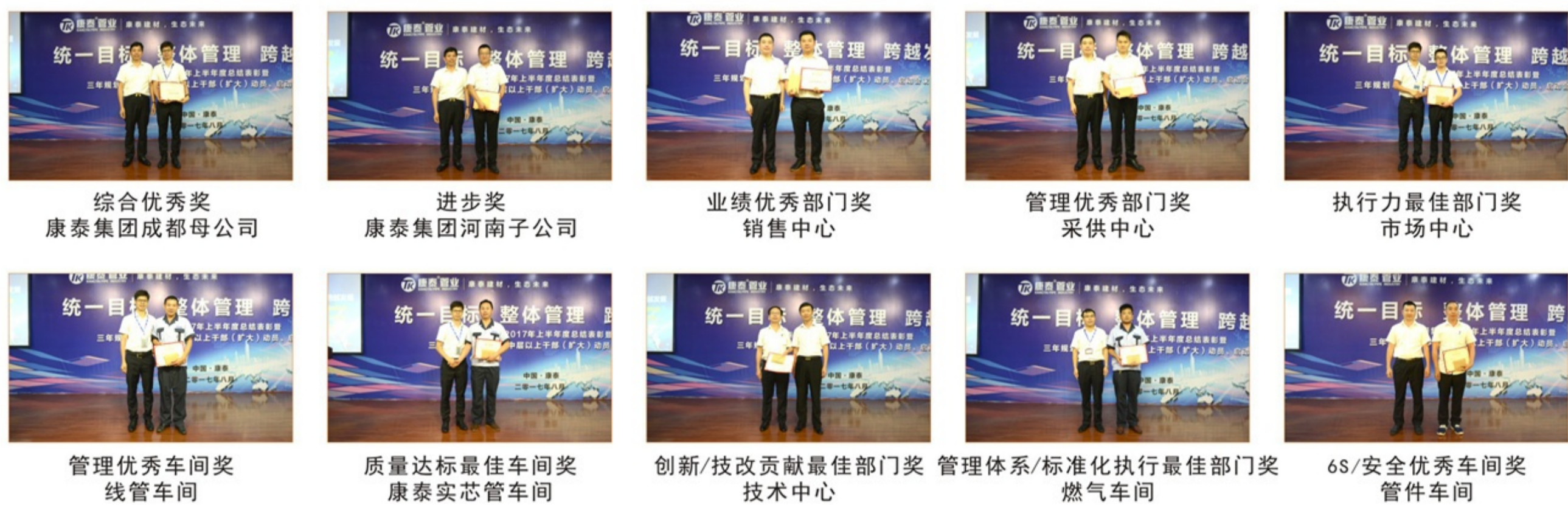
综合优秀奖 康泰集团成都母公司